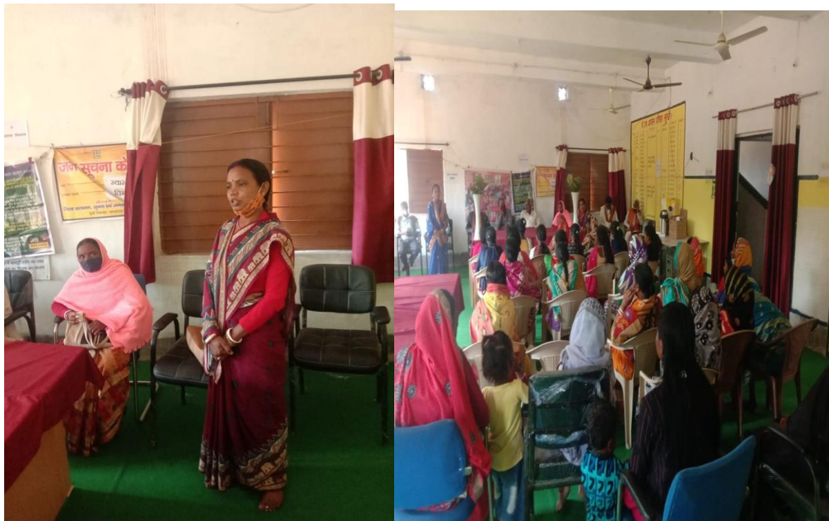
Réunion publique avec les dirigeants panchayat sur le terrain

Session interactive avec les chefs de village et les représentants du gouvernement: Une session interactive avec des représentants du gouvernement et des dirigeants d'organismes locaux s'est tenue le 19 février 2022. Le sujet de discussion était « L'autonomisation des femmes et des jeunes grâce à l'accès aux programmes gouvernementaux ». Le nombre total de participants était de 75. Des fonctionnaires du gouvernement et des dirigeants d'organismes locaux ont parlé aux participants des différents programmes gouvernementaux disponibles et des documents nécessaires pour y accéder, etc. De nombreux participants ont exprimé les problèmes auxquels ils sont confrontés.