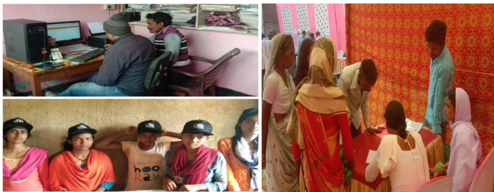
Centres de ressources pour les femmes en ligne

Deux centres de recherche pour femmes en ligne ont été créés. Le processus d'achat d'équipement numérique est terminé. Ces centres fonctionnent sous le nom de Mahila Sansadhan Kendras (E-Women's Resource Centres). Les centres jouent un rôle crucial dans l'organisation de réunions au niveau des villages pour organiser les femmes et les jeunes ruraux.