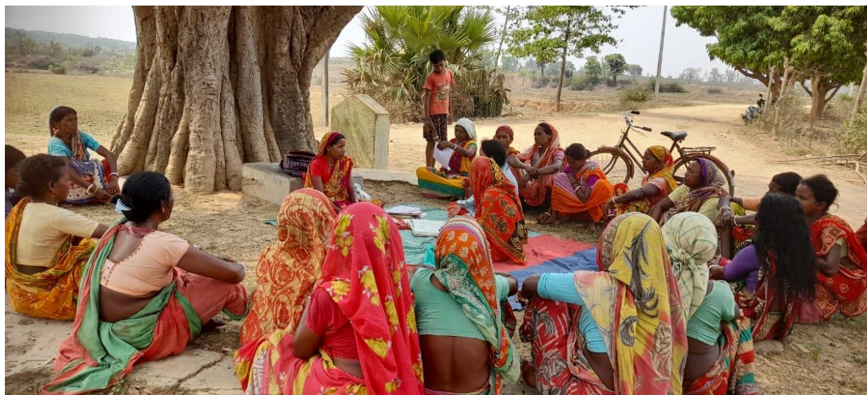
Rencontres au niveau du village

Réunions au niveau des villages : Ces rencontres ont été cruciales pour sensibiliser la base aux différents programmes gouvernementaux. Ceux-ci répondent avec succès à la diffusion d'informations sur les schémas et la collecte de données sur les systèmes auxquels on accède et auquel il faut accéder. Lors de ces réunions, une liste de femmes/jeunes/familles qui souhaitent accéder à différents programmes est préparée.