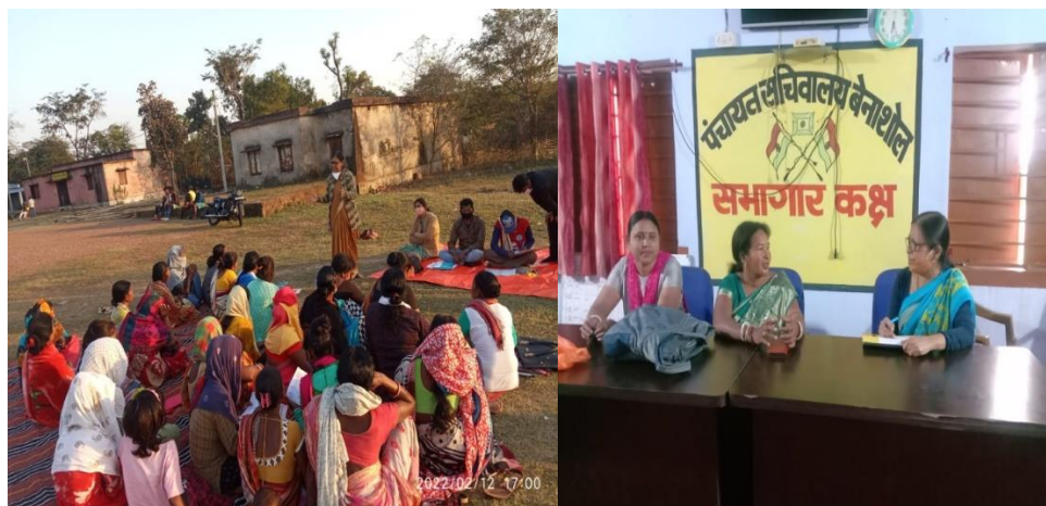
Interaction avec divers dirigeants panchayat

Interaction avec les dirigeants du Panchayat pendant les réunions du Gram Sabha : Les membres principaux de Swadhina et les bénévoles du WRC ont participé aux réunions du Panchayat au niveau du village pour poser des questions sur les demandes d'accès aux terres forestières pour les familles autochtones de la région. La discussion avec les dirigeants locaux du Panchayat a permis de mettre en avant la nécessité d'examiner les demandes en attente dans le cadre de la résolution. Les dirigeants du gouvernement local (Panchayat0) ont également promis d'apporter leur soutien sans réserve à cet égard.