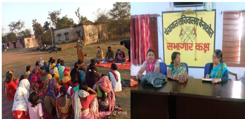
Interacción con varios líderes panchayat

Interacción con los líderes de Panchayat durante las reuniones de Gram Sabha: Los miembros principales de Swadhina y los voluntarios de WRC participaron en las reuniones de Panchayat a nivel de aldea para presentar problemas sobre las solicitudes de acceso a Forest Land para las familias indígenas de la región. La discusión con los líderes locales de Panchayat ayudó a plantear las necesidades de examinar las solicitudes pendientes como parte de la resolución. El gobierno local (los líderes de Panchayat) también prometieron extender su apoyo incondicional en este sentido.