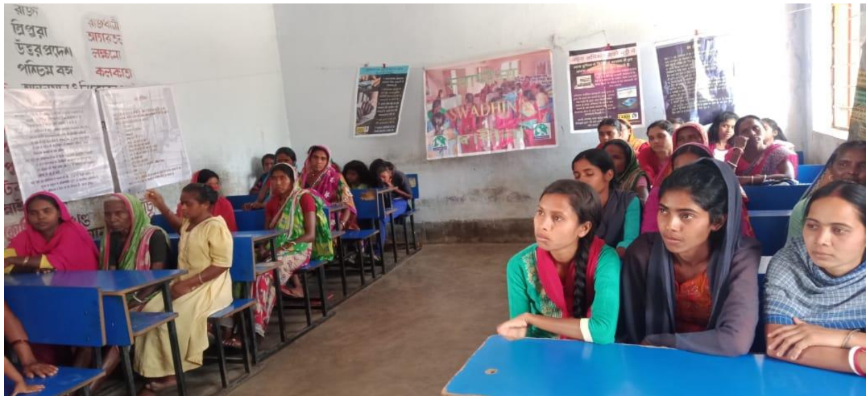
Encuentro interactivo sobre la tierra de los medios de vida basados en los bienes comunes

oportunidades de subsistencia a través de acciones basadas en la tierra. En total, 45 participantes, incluidas 41 mujeres, estuvieron presentes en esta ocasión.