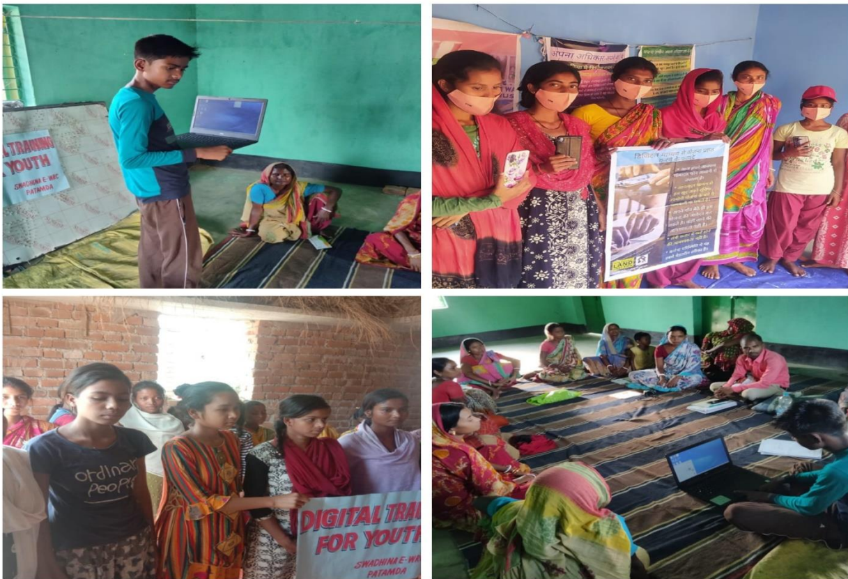
Atisbos de la capacitación en alfabetización digital

Capacitaciones digitales: Los voluntarios de Swadhina están llevando a cabo una serie de capacitaciones digitales para jóvenes en pequeños bolsillos para jóvenes y madres jóvenes. Los participantes aprenden sobre la importancia de la alfabetización digital para el autodesarrollo y la presentación de solicitudes en línea para esquemas gubernamentales. Hasta el momento , 120 jóvenes han sido cubiertos por el programa.